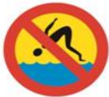
Zakaz skakania do wody